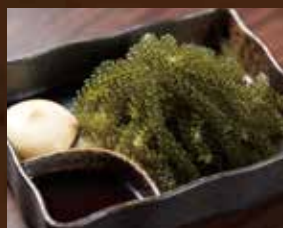
沖縄直送 本場の海ぶどう