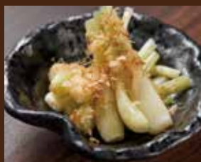
農家直送 烏らっきょう