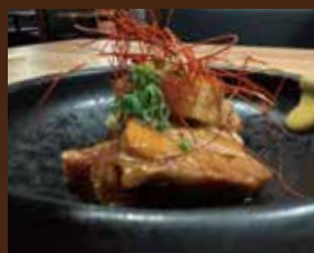
沖縄 豚角煮ラフテー